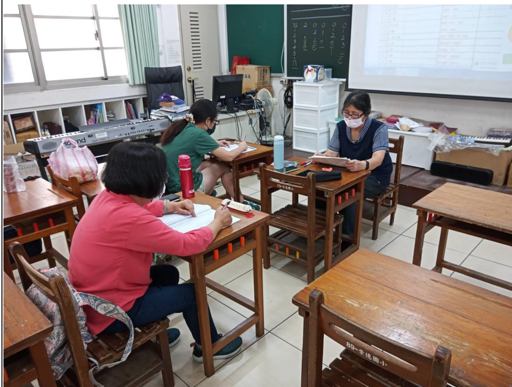
說明:111 年客家語字音字形暑假研習 地點:崇德國小螢光樓音樂教室