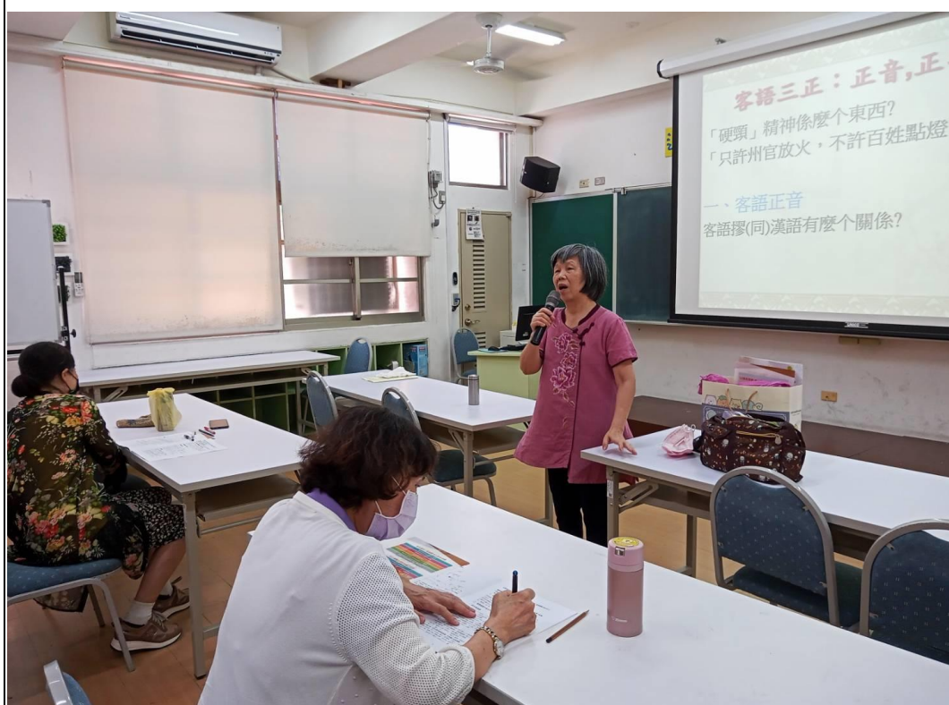
說明:111 客家俗諺(老古人言)个智慧地點:崇德國小螢光樓會議室