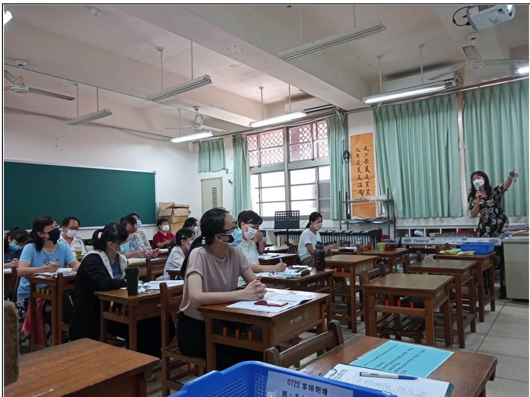
說明：111 客語朗讀國高組研習講義地點：崇德國小螢光樓音樂教室