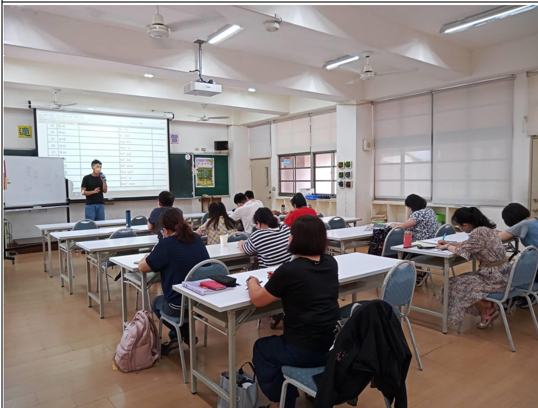
說明：111 年客家語字音字形暑假研習 地點：崇德國小螢光樓會議室