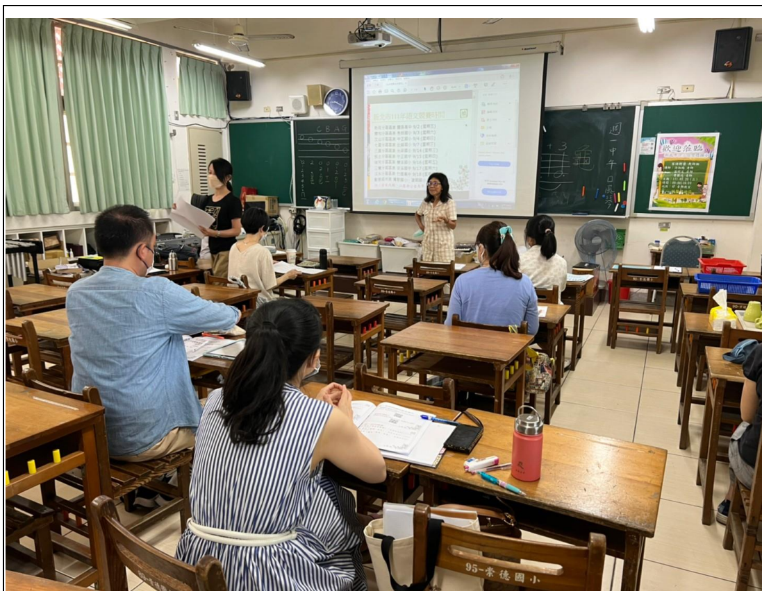
說明：新北市教師社會組客語朗讀研習地點：崇德國小螢光樓音樂教室