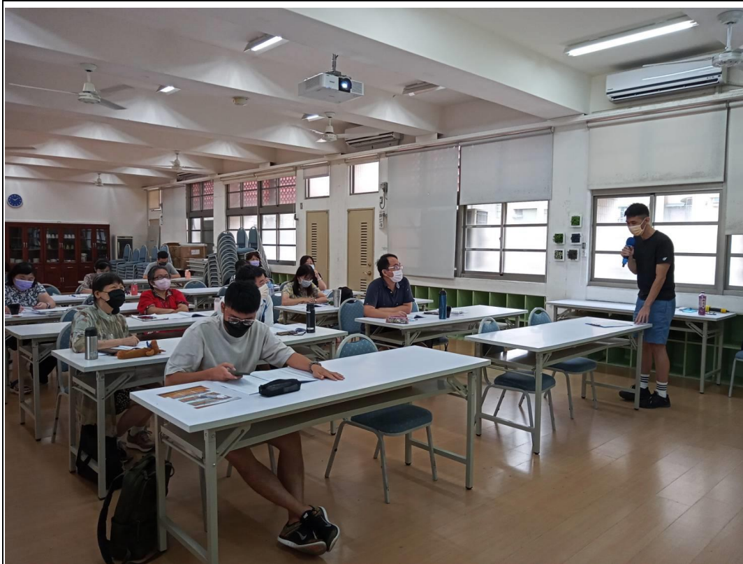
說明：111 年客家語字音字形暑假研習 地點：崇德國小螢光樓會議室