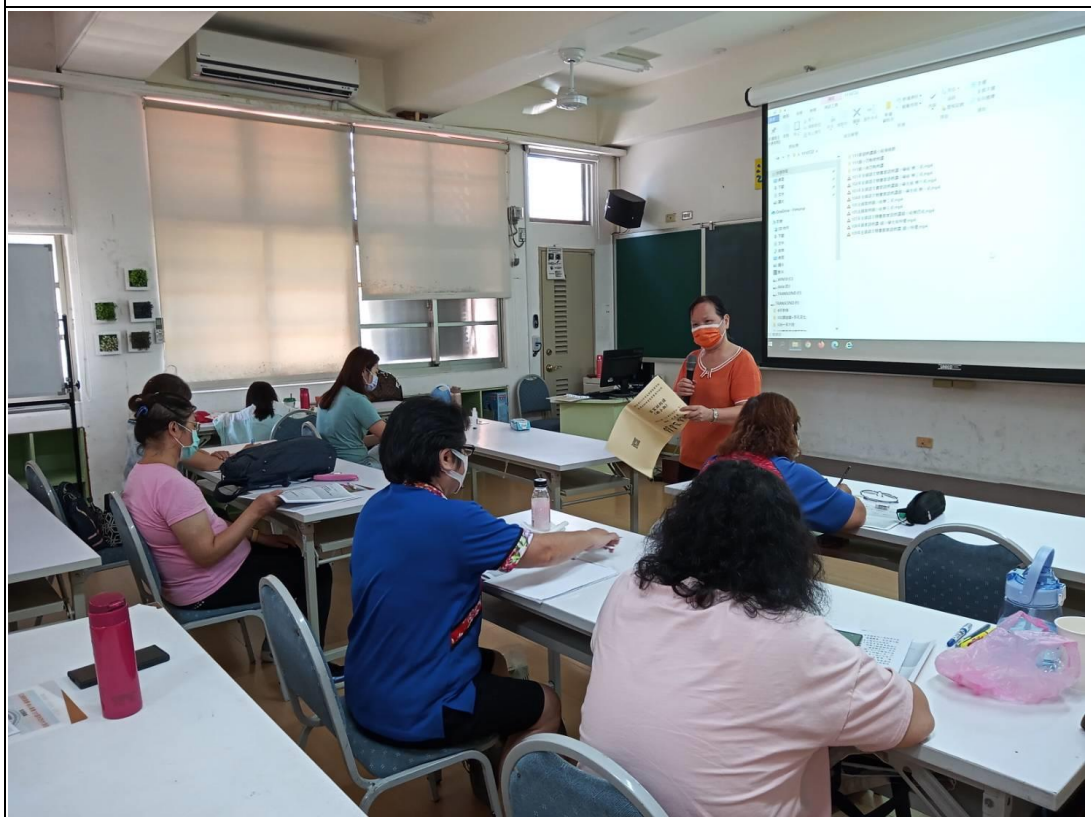
說明：111 客語朗讀國小組研習義 地點：崇德國小螢光樓會議室