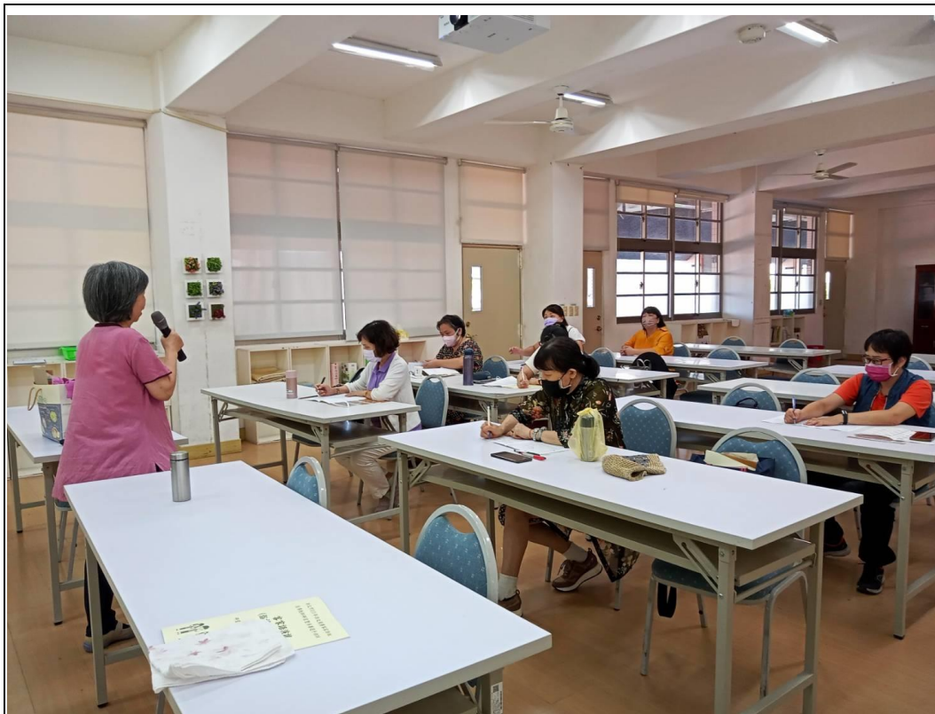
說明:111 客家俗諺(老古人言)个智慧地點:崇德國小螢光樓會議室