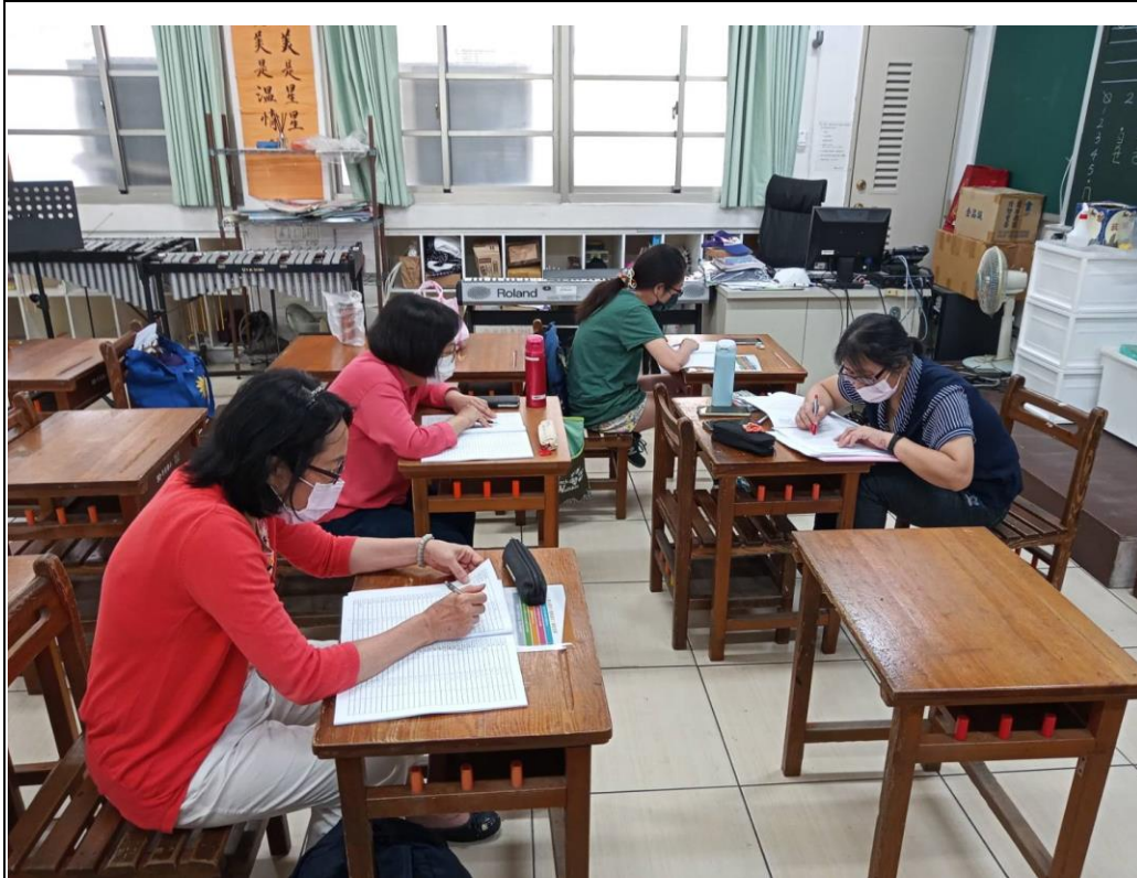
說明:111 年客家語字音字形暑假研習 地點:崇德國小螢光樓音樂教室