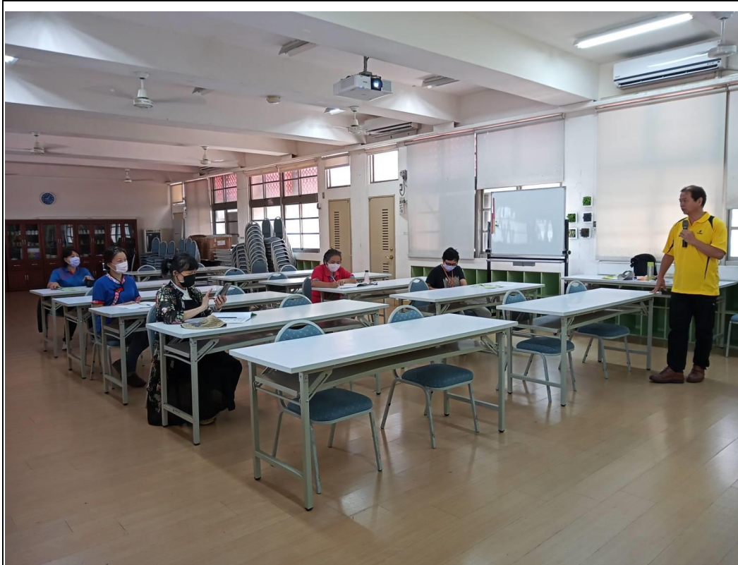
說明：純九大區賽即席演說 地點：崇德國小螢光樓會議室