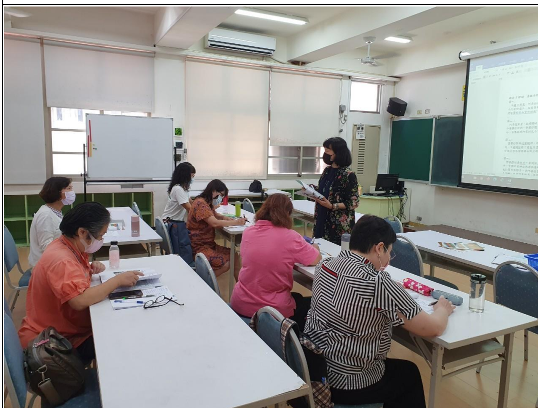
說明：客家語文情境式演說題目 地點：崇德國小螢光樓會議室