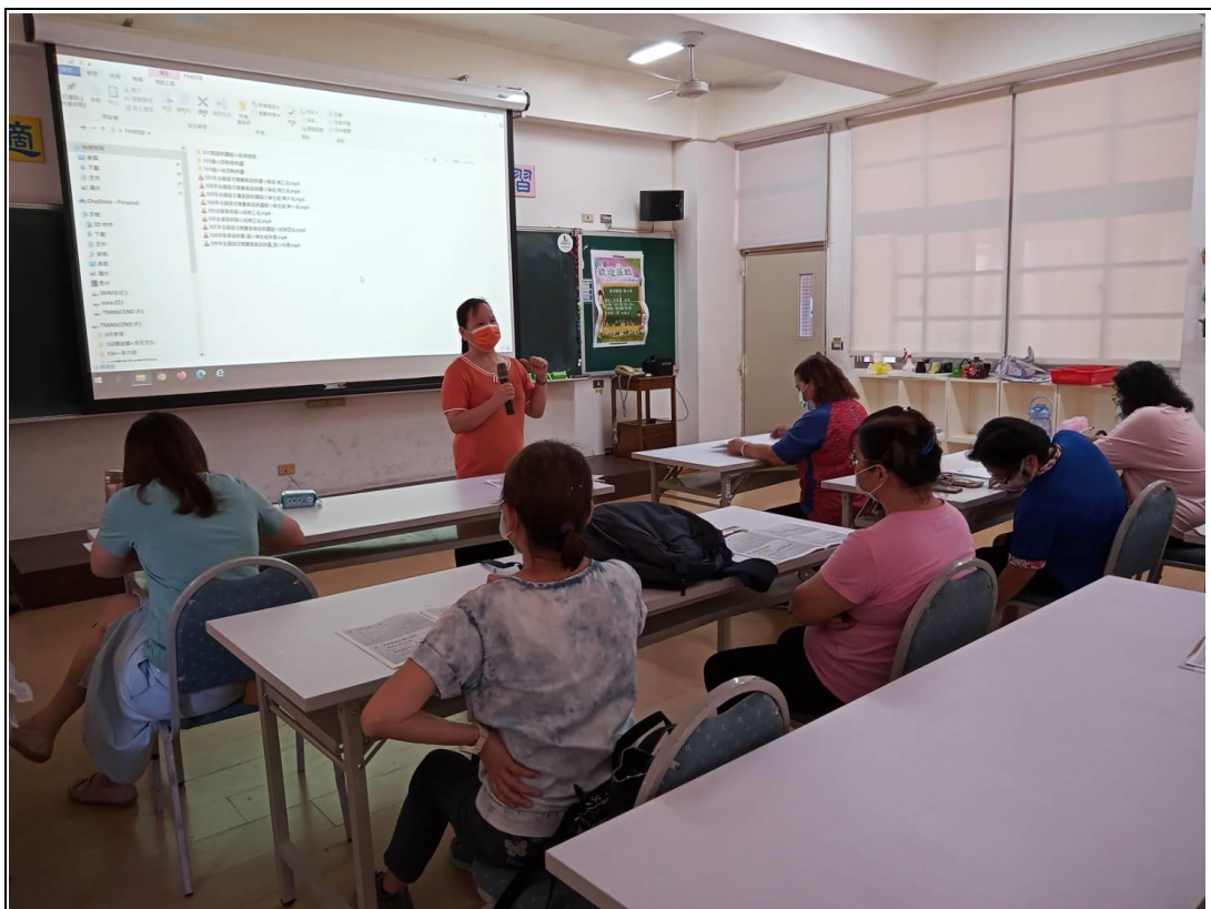
說明：111 客語朗讀國小組研習講義 地點：崇德國小螢光樓會議室