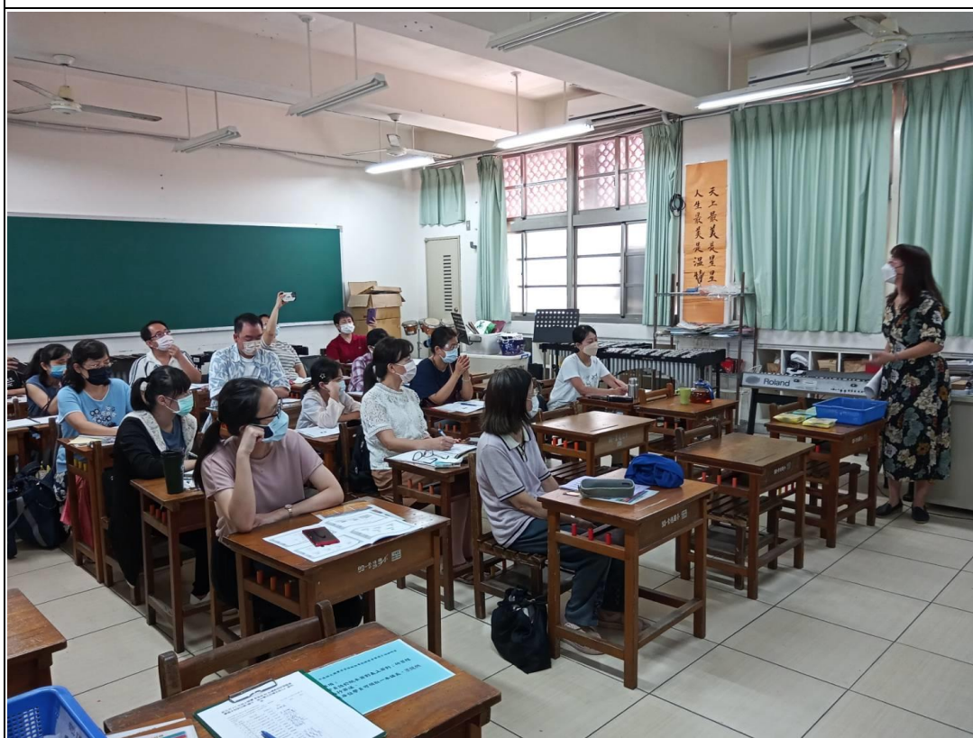
說明：111 客語朗讀國高組研習講義地點：崇德國小螢光樓音樂教室