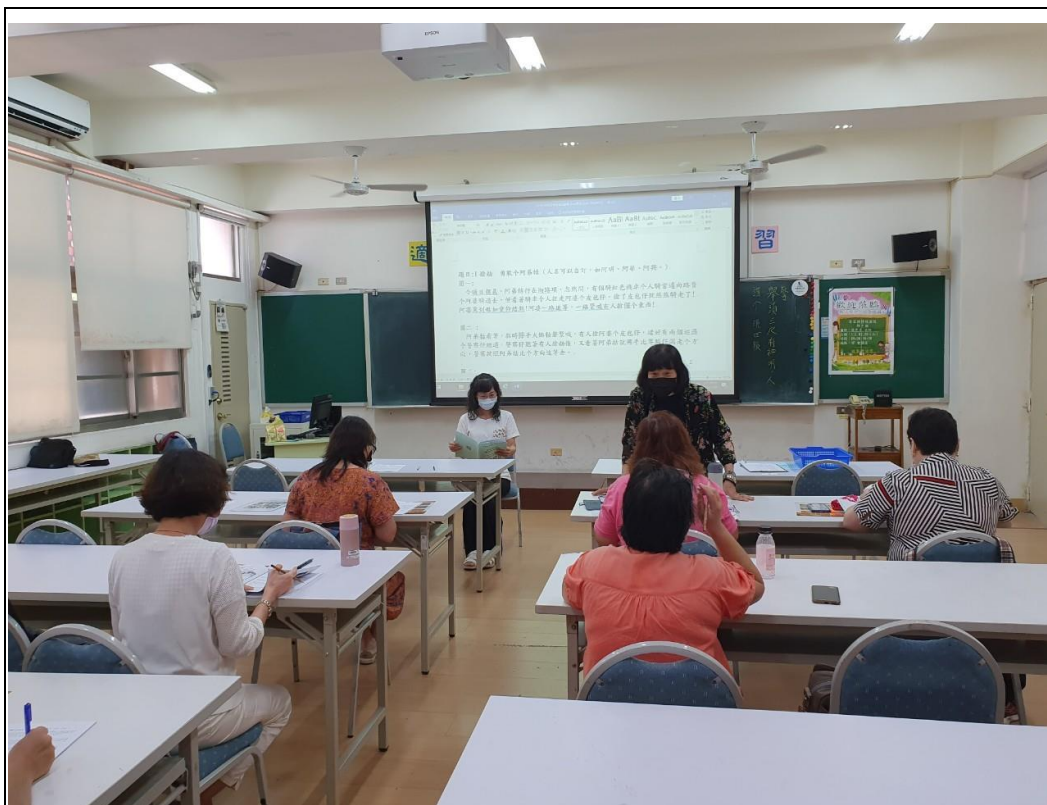
說明：客家語文情境式演說題目 地點：崇德國小螢光樓會議室