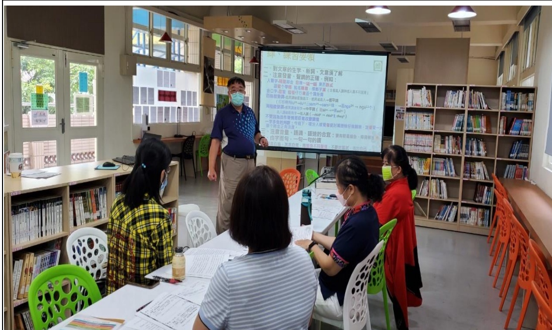
說明：新北市教師社會組客語朗讀研習 地點：崇德國小崇仁樓圖書館